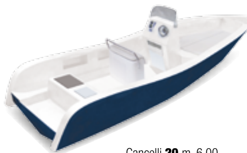
Cancelli 20 m. 6,00