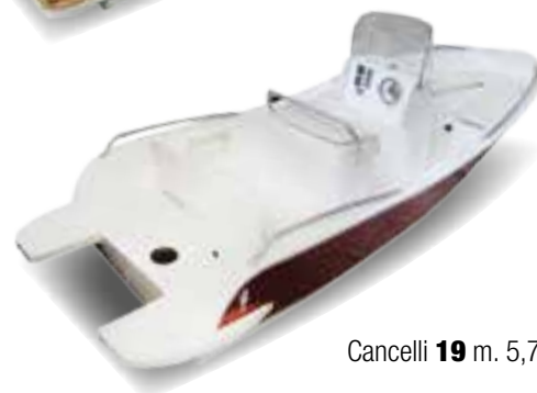
Cancelli 19 m. 5,7